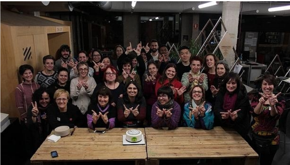
Todo el mundo usa Wikipedia, pero no todo el mundo sabe que esta gente la edita - WIKIESFERA