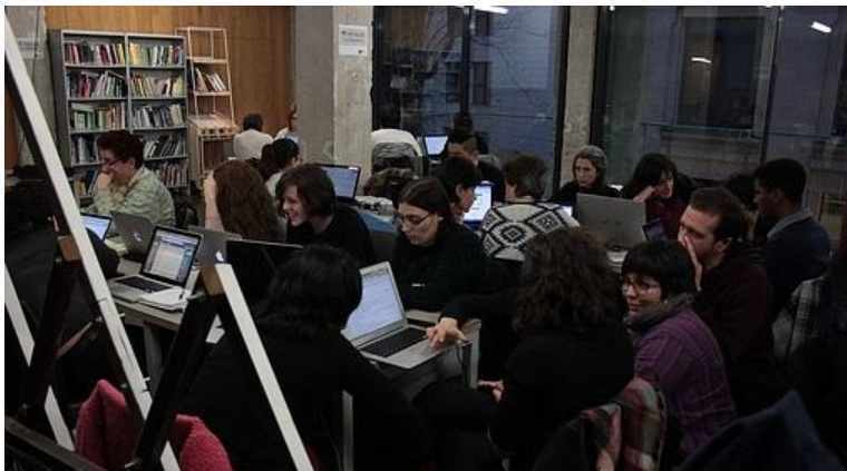
Esta es la estampa que se vive en los encuentros para editar Wikipedia- WIKIESFERA